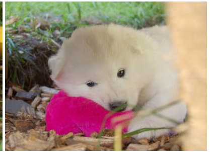
“Mein Schatz!...” (Teil II)