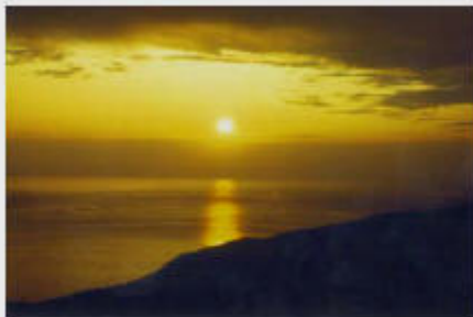
Mitternachtssonne / Polartag

Am längsten Tag geht die Sonne nördlich des Polarkreises nie unter. Am kürzesten Tag im Winter bleibt die Sonne nördlich des Polarkreises den ganzen Tag unter dem Horizont.